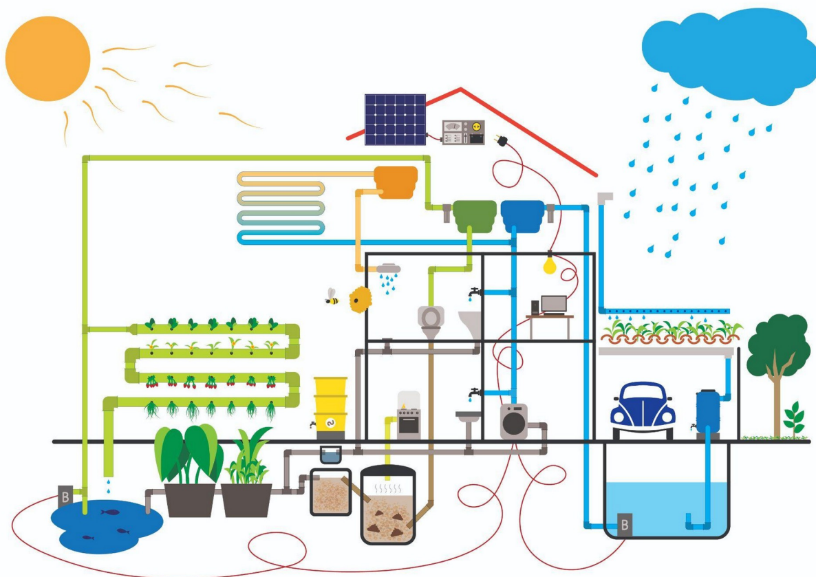
Figura 1: Casa Autônoma.

Assim, coube no recorte deste artigo discorrer sobre a utilização de práticas permaculturais a partir da pesquisa-ação, que consiste em elucidar problemas sociais ou técnicos, relevantes para a sociedade, por intermédio de pesquisadores membros da situação-problema que em parceria com outros atores interessados em resolver as questões propostas. No nosso caso as empresas, pessoas e coletivos parceiros se unem para aprimorar processos e desenvolver novas respostas, apoiados em referenciais teóricos que constituem a base para a elaboração de conceitos, as linhas de interpretação e as demais informações colhidas durante a investigação (Thiollent, Michel, 2022).